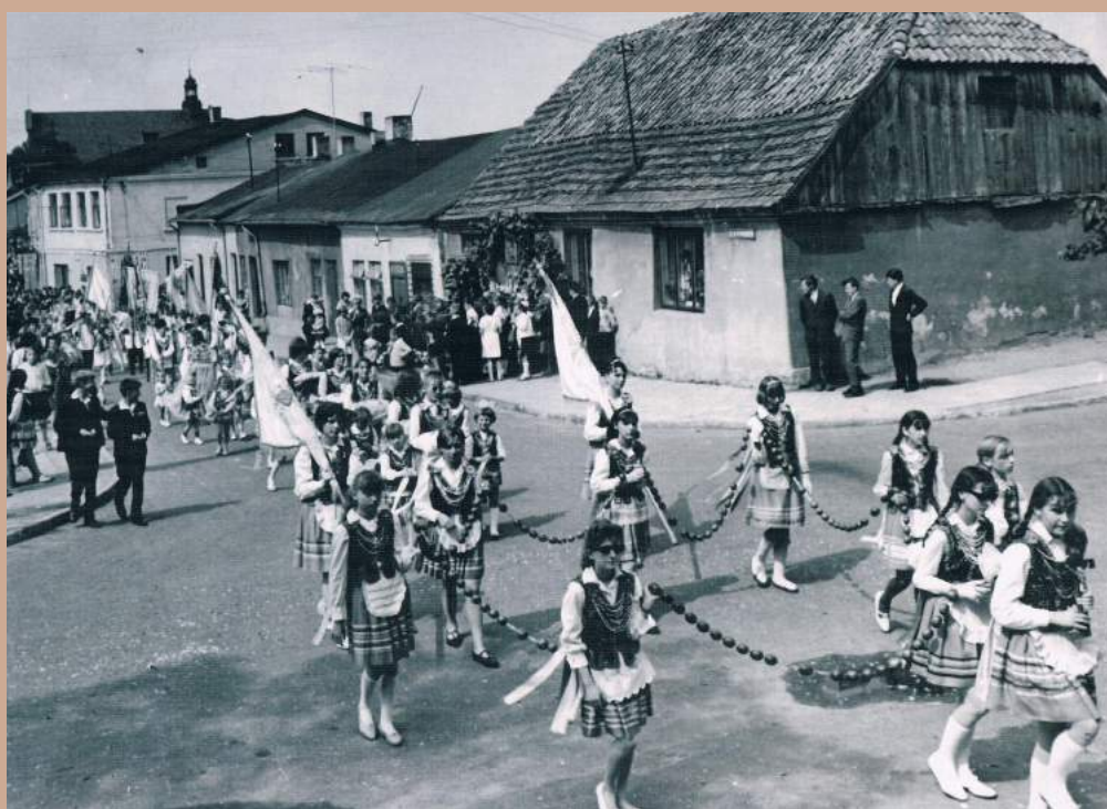
Procesja Bożego Ciała - Radziejów 1965 rok. (fotografia nadesłana)