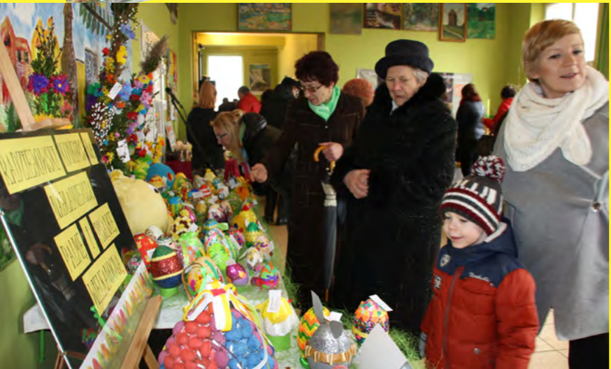
Prezentacja palm i pisanek- Radziejowski Konkurs na Najładniejszą Palmę i Pisanek Wielkanocną