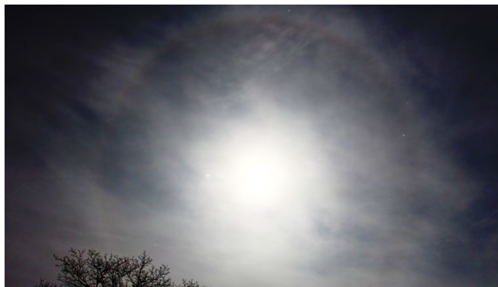
Halo księżycowe