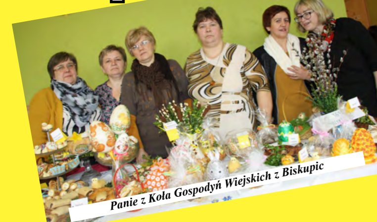
Panie z Kola Gospodyń Wiejskich z Biskupic