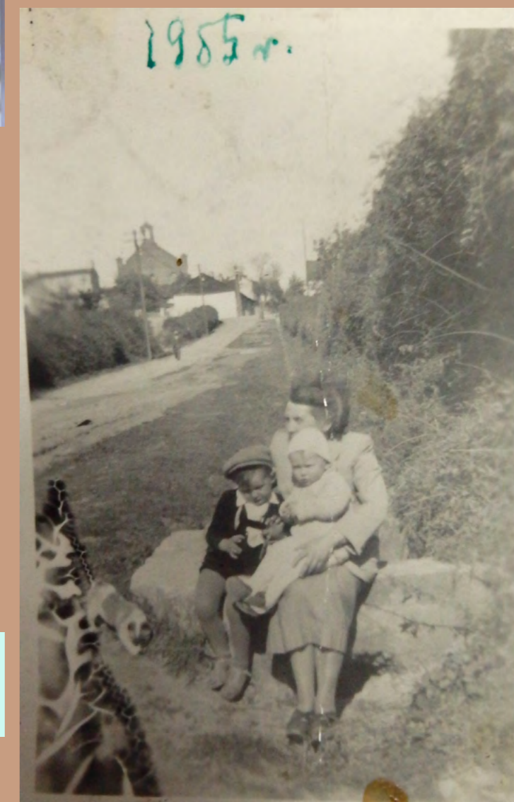
Mieszkanka Radziejowa, p. Szynkowska wraz z dziećmi. Zdjęcie wykonane na ul. Kruszwickiej - obecnie skwer miejski (schody), rok 1955, ze zbiorów prywatnych Krystyny Mróz