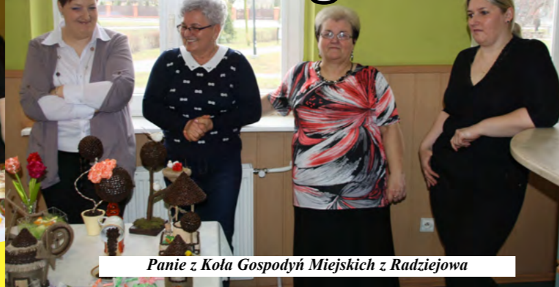
Panie z Kola Gospodyń Miejskich z Radziejowa