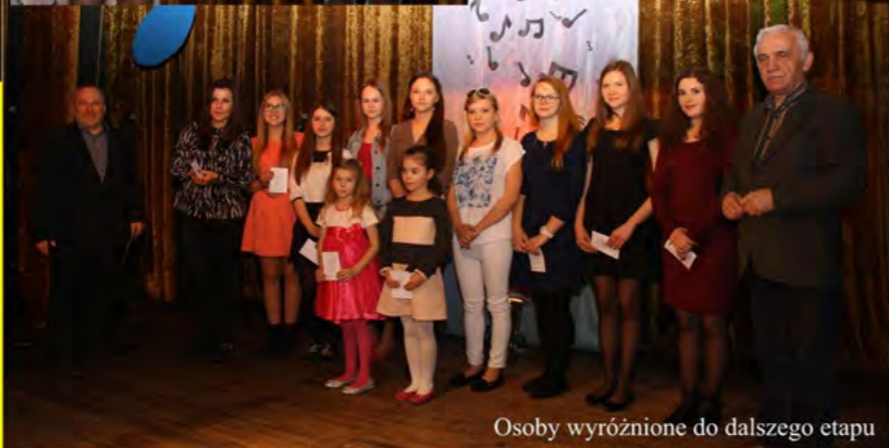
Osoby wyróżnione do dalszego etapu