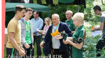
Zdjęcia i tekst: zespół RDK