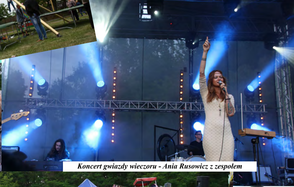
Koncert gwiazdy wieczoru - Ania Rusowicz z zespołem