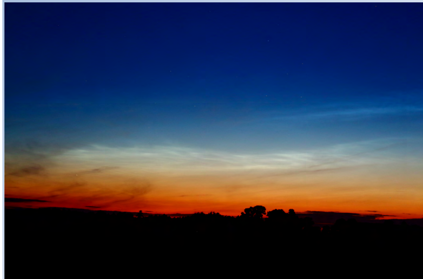
Jedno z pierwszych zdjęć obłoków srebrzystych wykonanych w tym roku w środkowej Polsce, zdjęcie wykonał Krzysztof Lisiecki