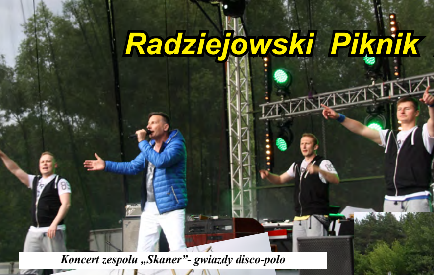
Koncert zespołu „Skaner”- gwiazdy disco-polo