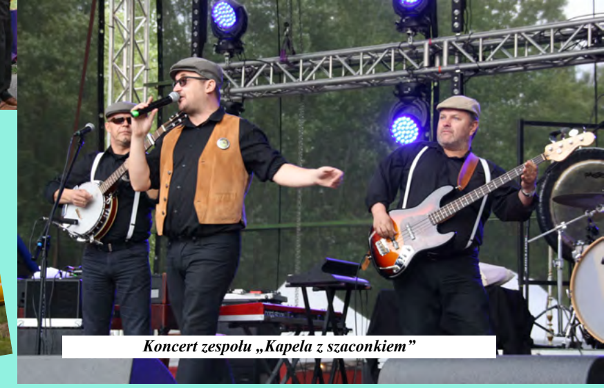
Koncert zespołu „Kapela z szacunkiem”