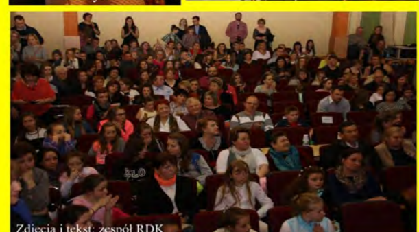
Zdjęcia i tekst: zespół RDK