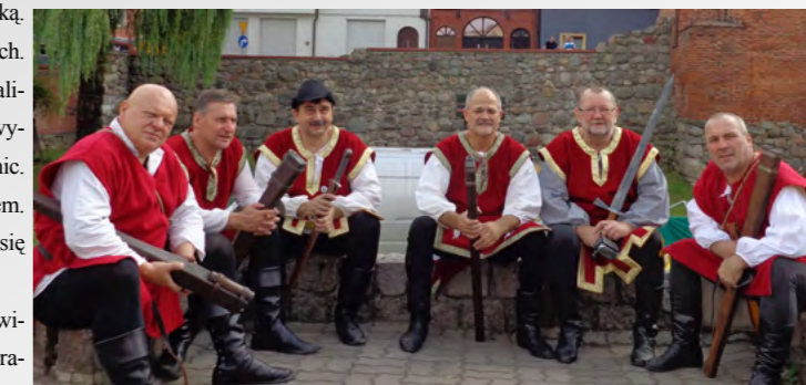
Zgraja Łotrzyków Radziejowskich