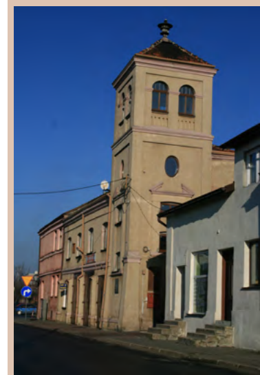
Widok na obecną remizę strażacką