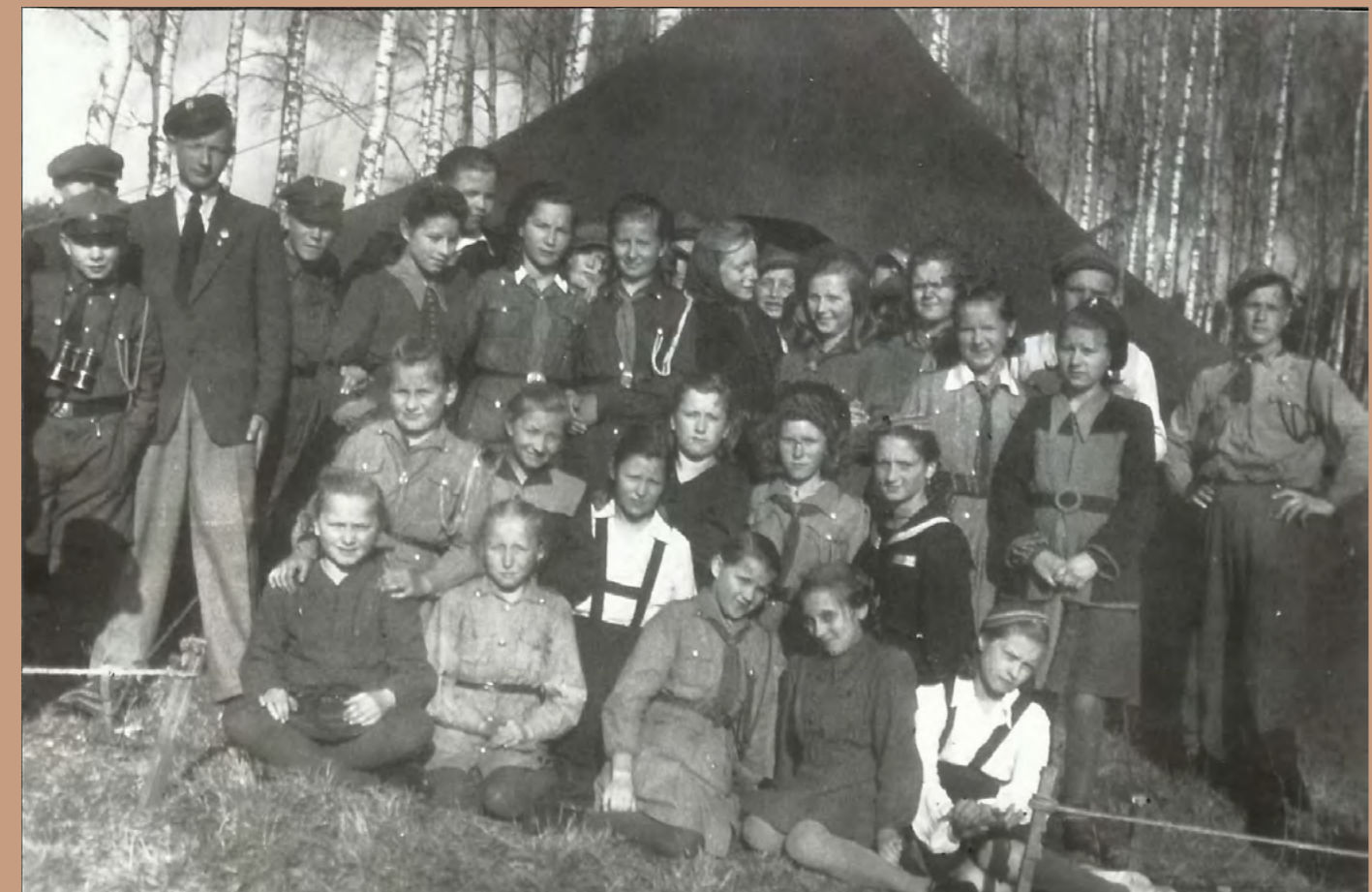
Pobyt radziejowskich harcerzy w lasku pod namiotem, wczesne lata 50-te