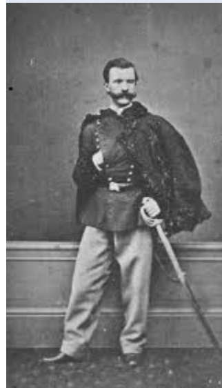
Generał Marian Langiewicz -2gi po Mierosławskim dyktator powstania 1863 roku

21 lutego 2016 roku odbył się IX Małogoski Zjazd Turystyczny szlakiem powstania styczniowego, zorganizowany z okazji 153 rocznicy wybuchu powstania styczniowego. W miasteczku odbyły się uroczystości patriotyczne, msza w intencji poległych obrońców ojczyzny, okolicznościowe prze-