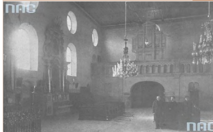
Wnętrze franciszkańskiego klasztoru przed jego przebudową, rok 1930.