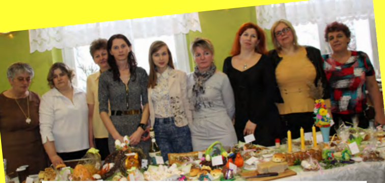
Kolo Gospodyń Wiejskich - Zagorzyce