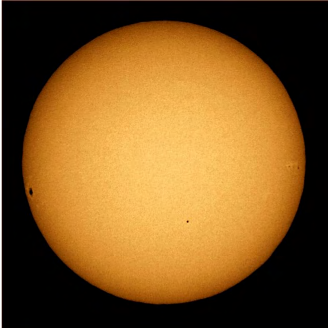
Tranzyt Merkurego w listopadzie 2006r.

Tranzyt Merkurego na tle Słońca 9 maja 2016 roku będzie najważniejszym tegorocznym wydarzeniem astronomicznym. Tranzyty Merkurego zdarzają się średnio 11 razy w ciągu stulecia, w okolicach 8-10 maja lub 10-12 listopada.