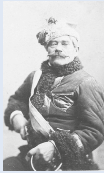
Józef Śmiechowski-Generał, dowódca kosynierów