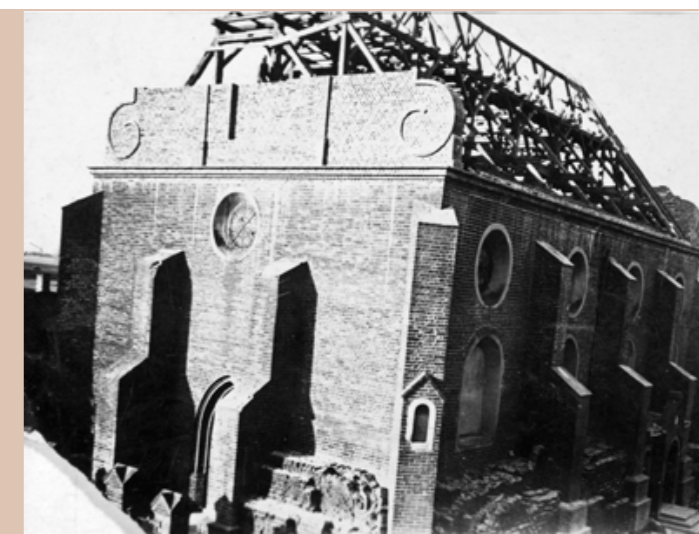
Kościół franciszkański w okresie przebudowy, rok 1930.