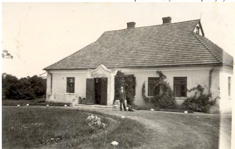
Dworek w Opatowicach, rok 1939.

„Romans” z Mickiewiczem rozpoczął jako sekretarz Komitetu Redakcyjnego Wydania Jubileuszowego Dzieł Poety, pogłębiając swoje zainteresowania polonistyczne jako pracownik naukowy w Instytucie Badań Literackich Polskiej Akademii Nauk w Warszawie. W latach 1957-1959