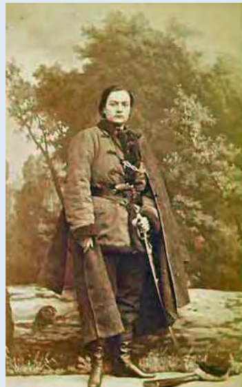
Anna Henryka Pustwójtówna- kobieta powstaniec adiutantka M. Langiewicza