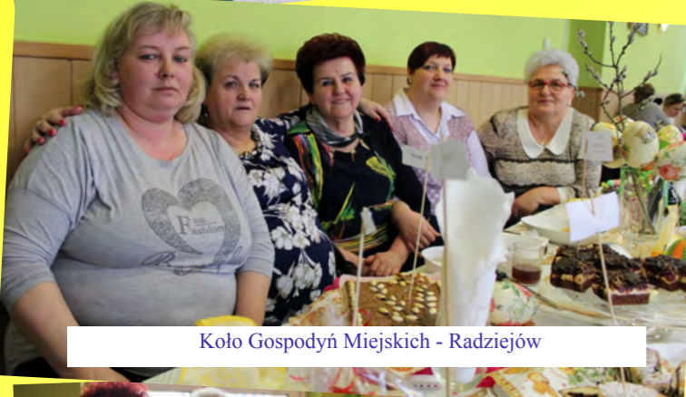
Kolo Gospodyń Miejskich - Radziejów