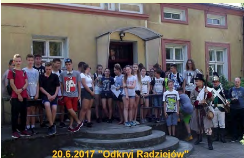
20.6.2017 "Odkryj Radziejów"

średnich we współpracy z Urzędem Miasta w Radziejowie popularyzującą historię miasta (20-21.06.2017 r.).