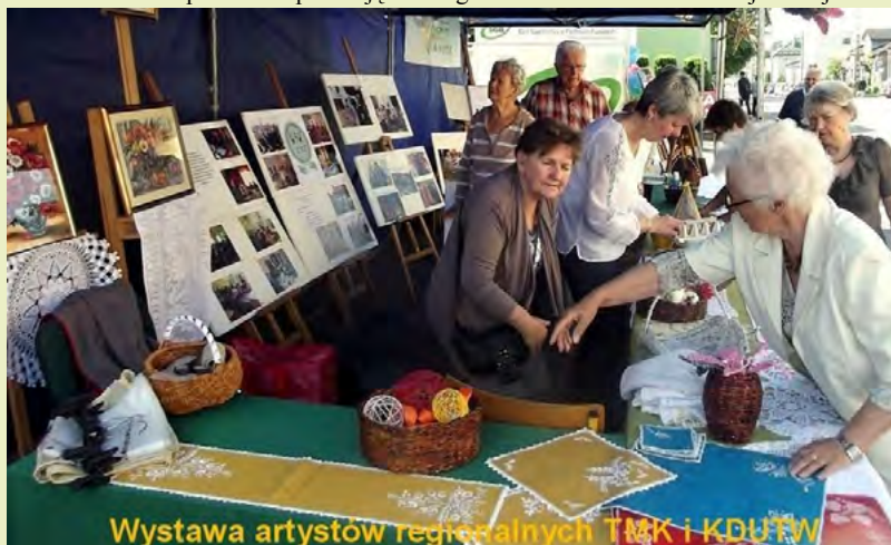
Wystawa artystów regionalnych TMK i KDUiW

- spotkanie i prelekcję z etnografem z Muzeum Ziemi Kujawskiej i Do-