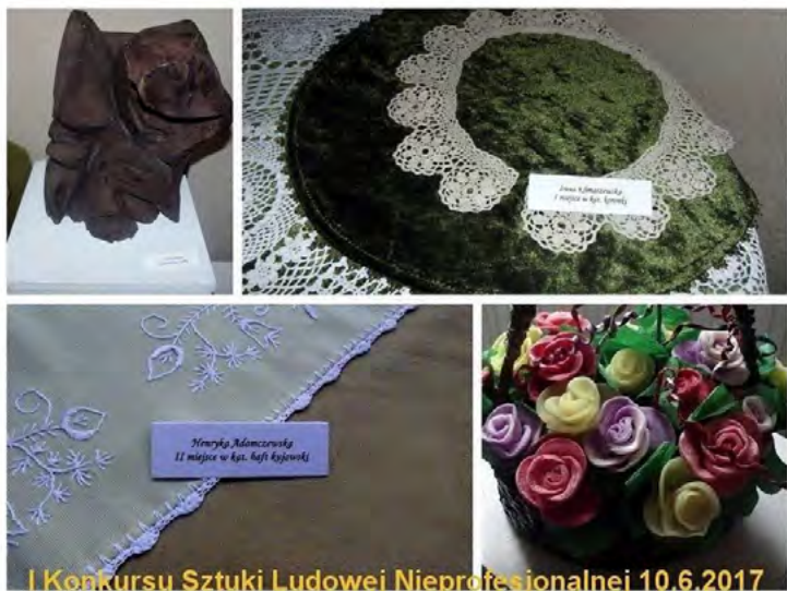
I Konkursu Sztuki Ludowej Nieprofesjonalnej 10.6.2017

Od ponad roku TMK ma nową siedzibę w budynku „starej plebanii” na ulicy Kruszwickiej 1. Tu także mieści się Izba Regionalna, której administratorem jest Miejska i Powiatowa Biblioteka Publiczna w Radziejowie. Właścicielem zgromadzonej w niej ekspozycji oraz opiekę nad nią sprawuje stowarzyszenie. Środki