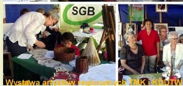
Wystawa artystów regionalnych TMK i KDUiTW