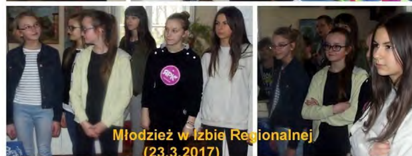
Młodzież w Izbie Regionalnej (23.3.2017)