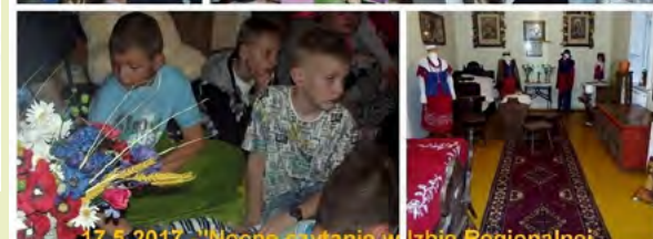
17.5.2017 - Nocne czytanie w Izbie Regionalnej