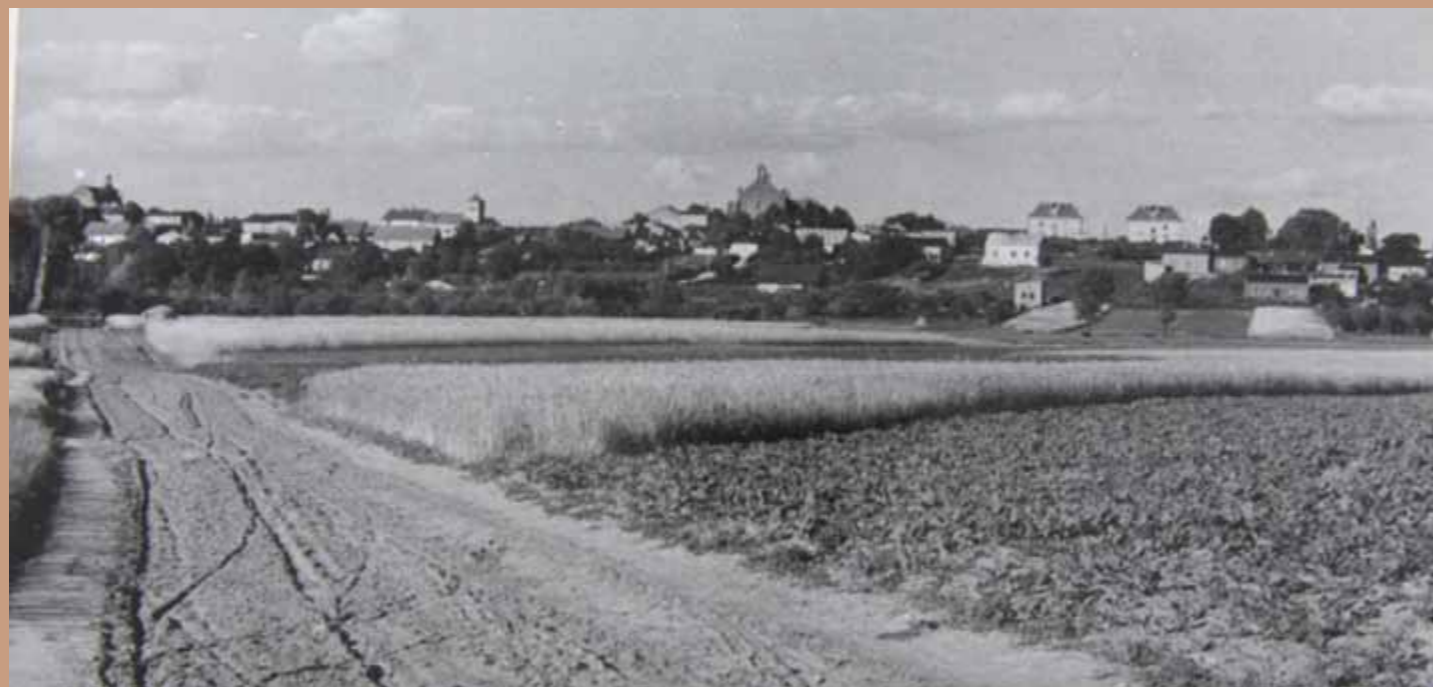
Panorama Radziejowa od strony obecnej ul. Szpitalnej, okres PRL