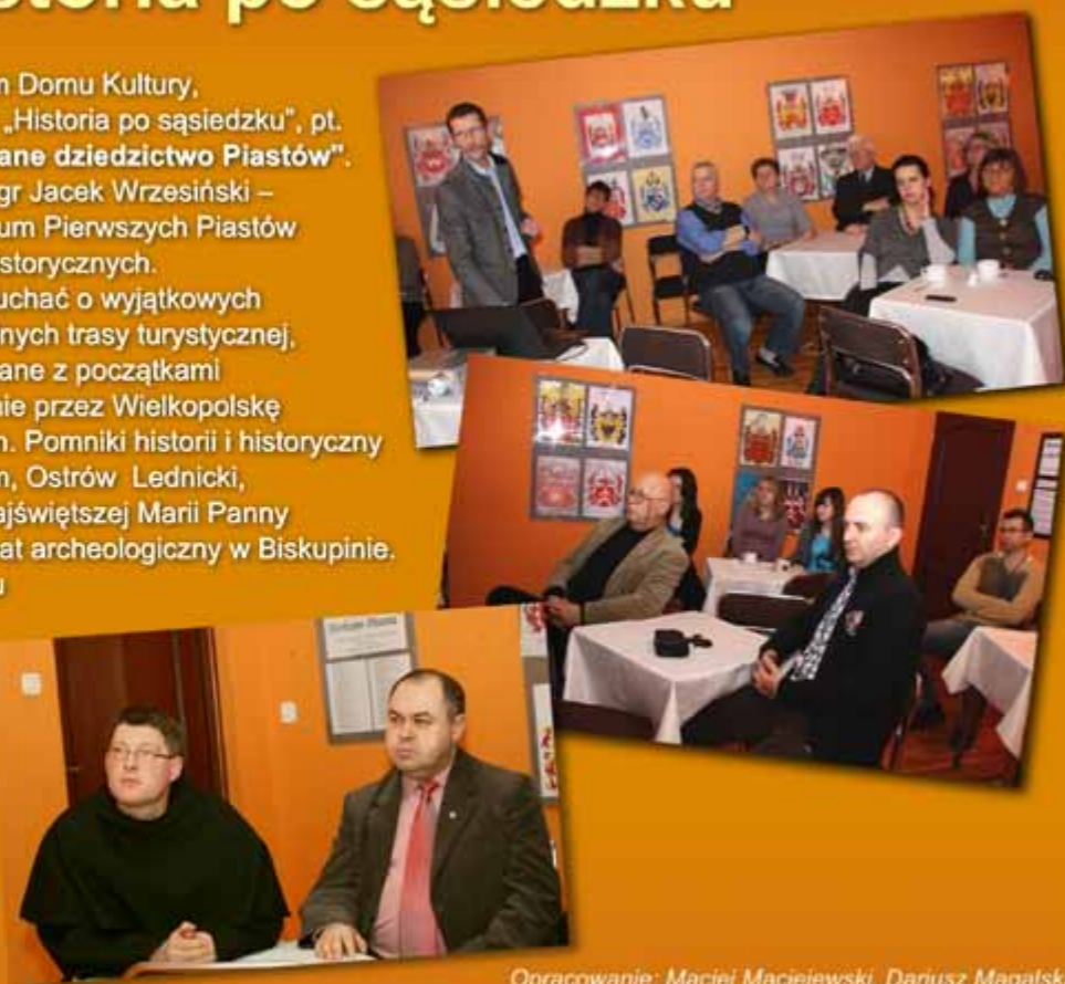
Opracowanie: Maciej Maciejewski, Dariusz Magalski

W październiku ubiegłego roku na zaproszenie dyrektora RDK, Radziejów odwiedzili członkowie Organizacji Turystycznej Szlak Piastowski. Stowarzyszenie gnieźnieńskie chce poszerzyć szlak o miasto Radziejów.