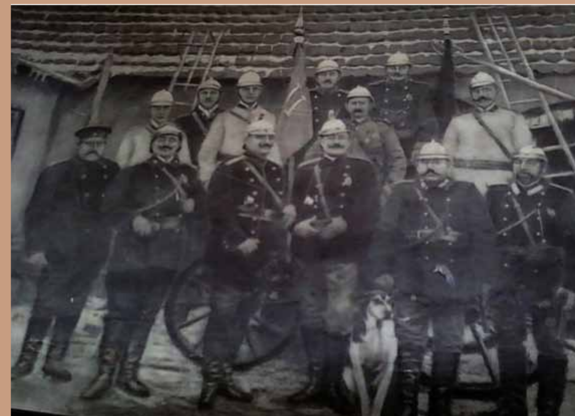
Druhowie Ochotniczej Staży Pożarnej z Radziejowa, rok 1902