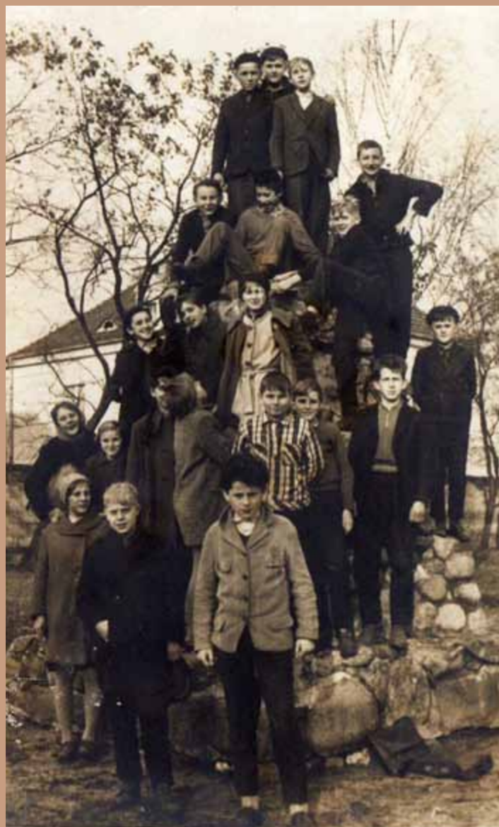
Rok 1964, uczniowie stojący obok nieistniejącego obecnie pomnika przy LO w Radziejowie