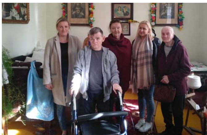
Wizyta pensjonariuszy z Domu Opieki dla Osób Starszych w Dębach