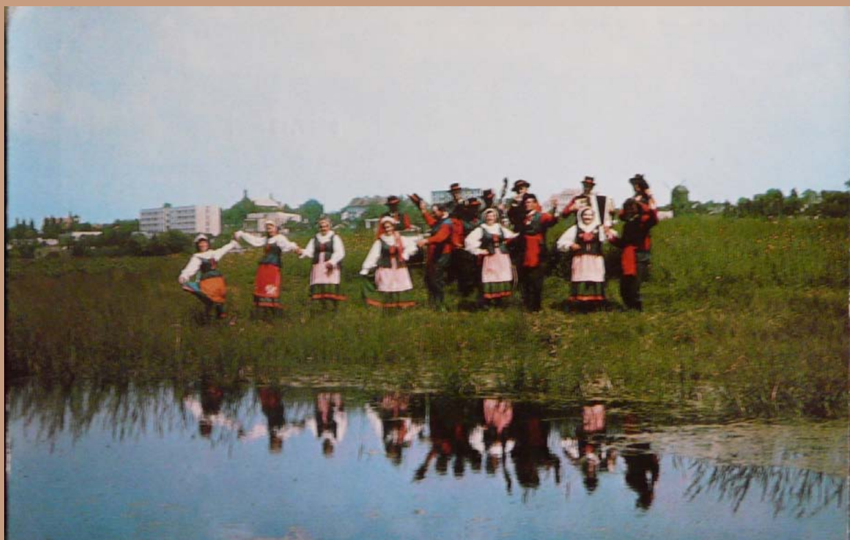
Zespół Pieśni i Tańca „Kujawy” na tle panoramy Radziejowa, lata 80-te XX wieku.