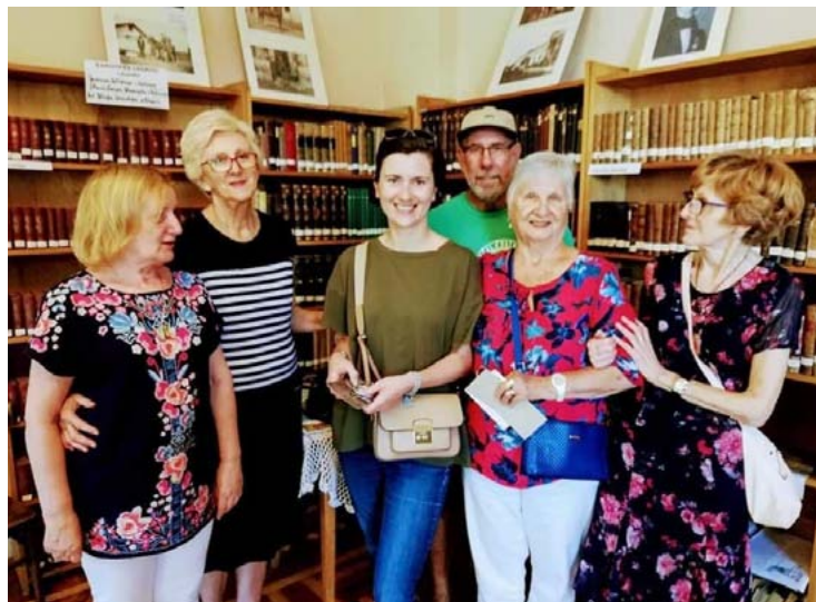
Goście z Australii