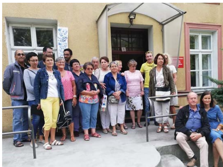
Goście z Francji