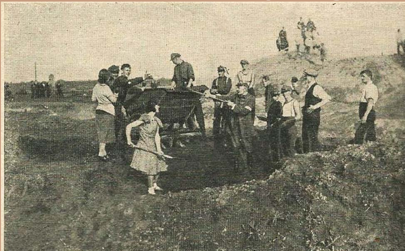
Sypanie kopca w Płowcach dla upamiętnienia na 600-lecia Bitwy pod Płowcami. Główne uroczystości państwowe odbyły się we wrześniu 1931 roku.