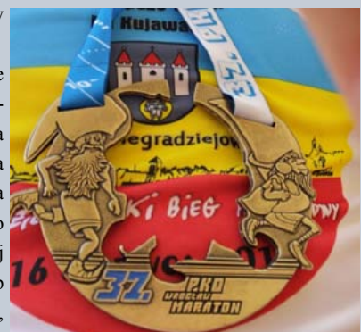
Pamiątkowy medal 37. PKO Wrocław Maraton