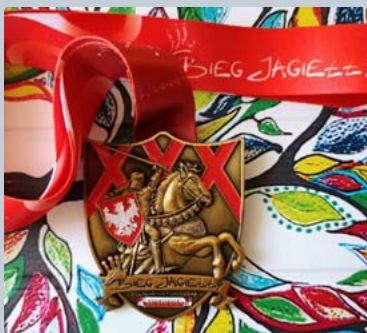
Pamiątkowy medal XXX Bieg Jagielly - Pobiedziska