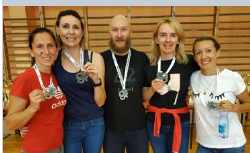
8 Memorial im. Henryka Warwasa - Kleczew

Nie mówimy ostatniego słowa. Nasz następny raport już przed Świętami Bożego Narodzenia.