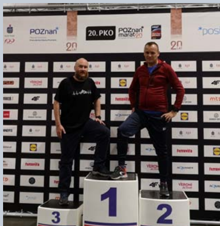
30 PKO Poznań Maraton