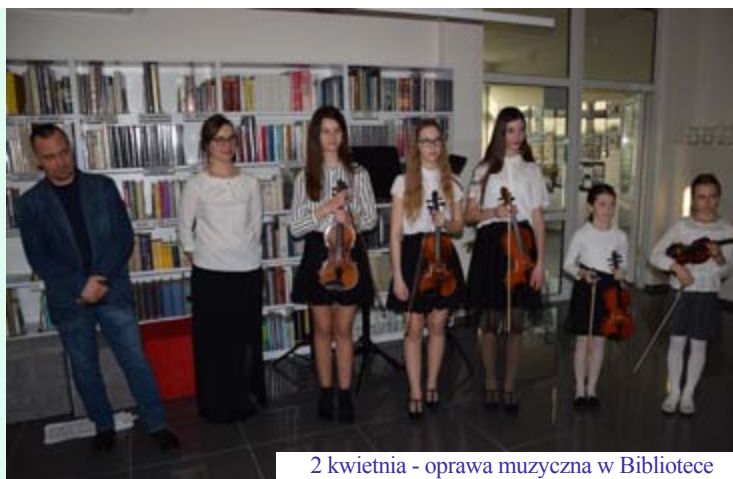
2 kwietnia - oprawa muzyczna w Bibliotece

Zachęcamy do śledzenia naszych kroków na stronie internetowej i portalach społecznościowych!