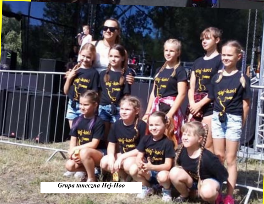
Grupa taneczna Hej-Hoo