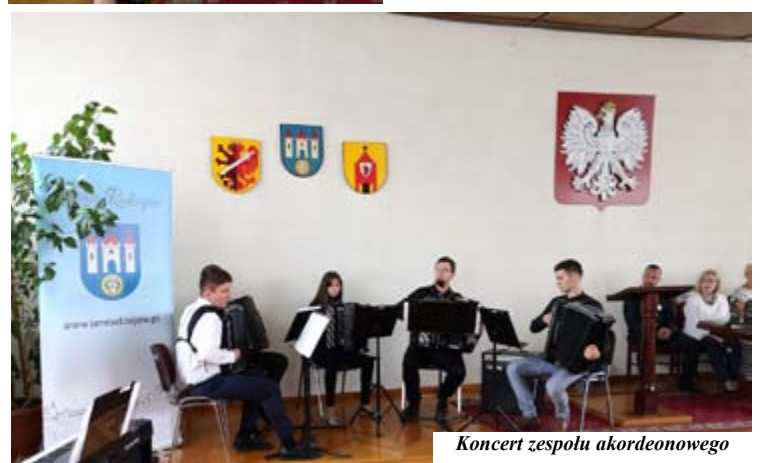
Koncert zespołu akordeonowego