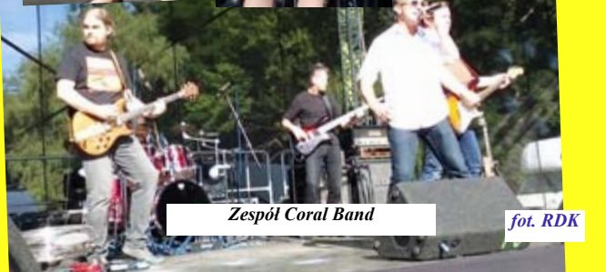
Zespół Coral Band