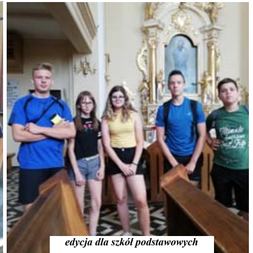
edycja dla szkół podstawowych