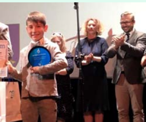
VI Rypiński Konkurs Etiud Fortepianowych