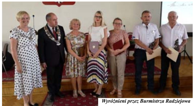
Wyróżnieni przez Burmistrza Radziejowa