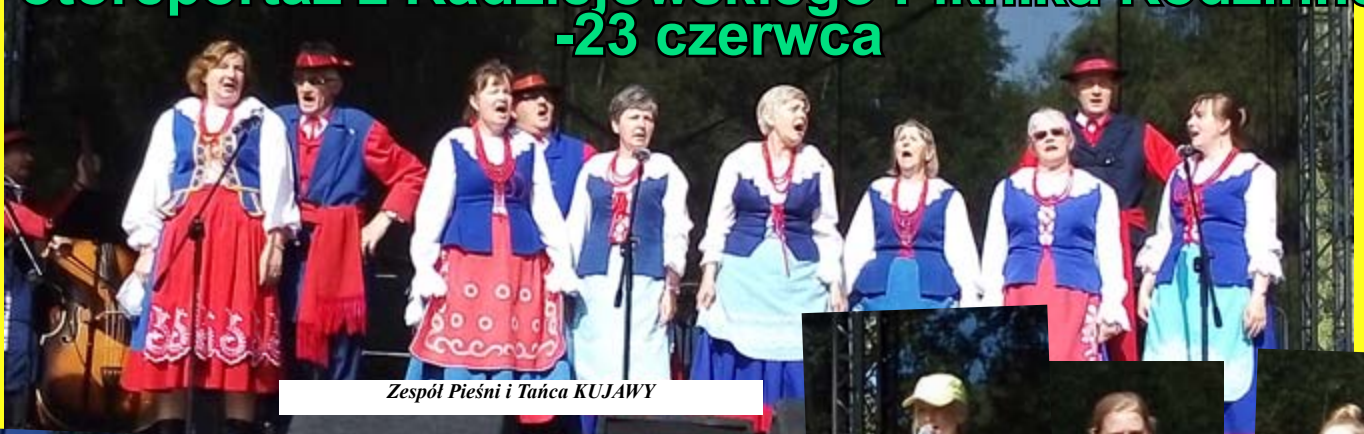
Zespół Pieśni i Tańca KUJAWY