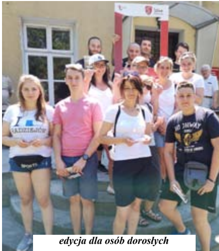
edycja dla osób dorosłych

Po raz pierwszy zorganizowano także grę dla osób dorosłych. W sobotę (22 czerwca) udział w niej wzięły 4 drużyny: Pędzące Ślimaki, Białe Damy, Bolt oraz Witowo. Każda z drużyn podczas gali ogłoszenia wyników zabawy otrzymała materiały promocyjno-historyczne oraz w zależności od zajętego miejsca: złote, srebrne i brązowe odznaki „Odkrywcza Radziejowa”.